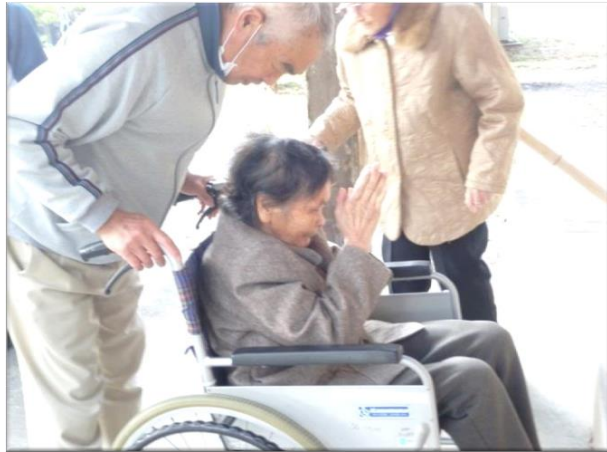
お願いごとは何ですか？