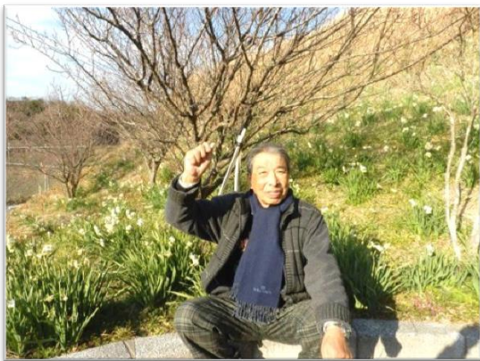
花盛りの水仙を堪能 しました。