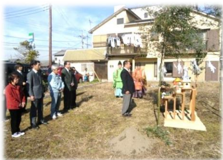
【地鎮祭・安全祈願】

2013年10月より開所予定の「湊新規事業所」建設の歩みです。また、名称と概要も決定しましたので併せてお知らせいたします。