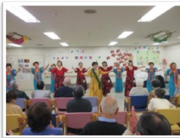
☆ケアハウス(フラダンス) プリメーラ 鋸南様

華やかな衣装に、ハワイに来たかと思わせるような踊りを披露いただきました。 「これだけたくさんの曲を披露するのは大変だったでしょう」と感激されていました。