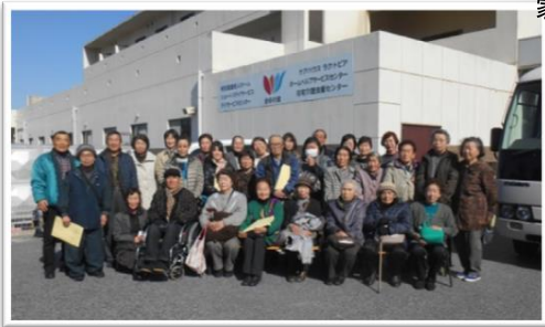
施設見学 天神山地の社会福祉協議会の皆様