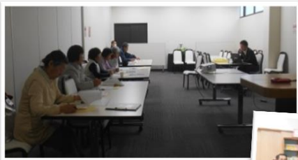
出前講座(十全社様)