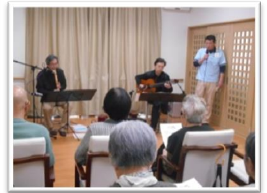
☆ きんこくの家(演奏会) WAYO様

華やかな衣装に、ハワイに来たかと思わせるような踊りを披露いただきました。 「これだけたくさんの曲を披露するのは大変だったでしょう」と感激されていました。