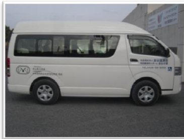
○配備車輛 トヨタ ハイエース リフト車輛

この度、公益財団法人中央競馬馬主社会福祉財団様、一般社団法人中山馬主協会様より助成をいただき、リフト車輛を一台配備しました。今後は、送迎や通院、外出行事等で活躍します。