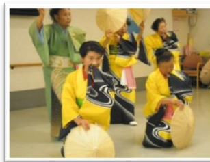
☆ 特養(演奏会) 金谷友の会・女性委員様

ギターと尺八によるタンゴから唱歌まで幅広い演奏に、利用者の皆様はうっとり聞きほれていらっしゃいました。