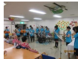
天羽高等学校 吹奏楽部・合唱部様

☆ケアハウス 高校生の一生懸命な生の演奏や歌声に、感激され涙する方もみられました。