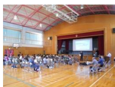
金谷・竹岡地区の皆様 ありがとうございました

できる限り住み慣れた地域で安心した生活ができるように支援させていただきます。出前講座を開催しています。今回は、金谷・竹岡地区におじゃまして来ました。地域包括支援センターの役割について説明後、体操等を行い、ほのぼのとした時間を過ごさせていただきました。他方面への出前講座も計画中です。皆様のご協力をよろしくお願いいたします。